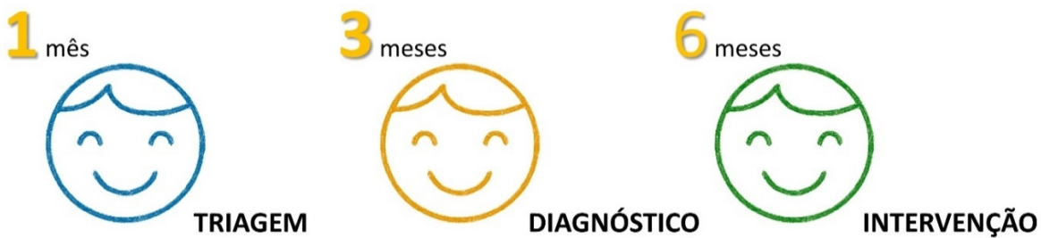
Figura 1- Etapas da TANU até a intervenção quando necessária (Etapas 1-3-6)

Caso a criança falhe na TANU antes da alta hospitalar, recomenda-se que ela faça um novo teste (chamado de RETESTE) após 15 dias da alta hospitalar. Caso esta falha permaneça, deve-se realizar o encaminhamento para diagnóstico médico e audiológico com o objetivo de confirmar a existência ou não da perda auditiva. Tem-se como meta, portanto, a realização da TANU no primeiro mês de vida (1); a confirmação da perda auditiva até o terceiro mês de vida (3); a intervenção clínico-terapêutica deve ter início no terceiro mês de vida e no máximo no sexto mês (6) - Etapas 1-3-6 (Figuras 1 e 2). Estas ações propiciam as melhores condições para tratamentos disponíveis, pensando-se na plasticidade neuronal da criança. 3,5